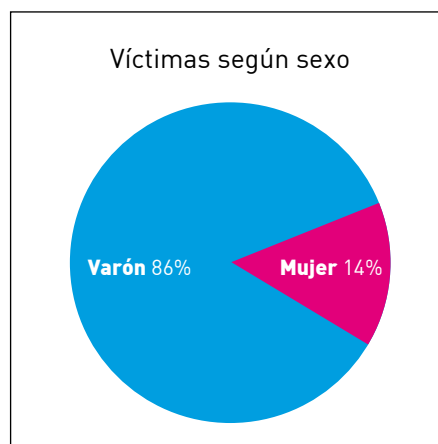
Cuadro 3: Víctimas de homicidios/femicidios y lesiones graves

En el cuadro 1 podemos ver que, con excepción de los delitos vinculados a la violencia sexual, los varones suelen ser las víctimas más frecuentes, especialmente de homicidios y lesiones. Cuando desagregamos estas últimas categorías según sexo (Cuadros 2 y 3) advertimos que el 94% de los autores de tales delitos son varones. La impregnación de lo masculino en los cuadros anteriores merece ser analizado desde una perspectiva que incluya los elementos conceptuales que hemos desarrollado al comienzo de este trabajo, ya que no es suficiente con describir esta realidad, sino que hay que intentar explicarla.